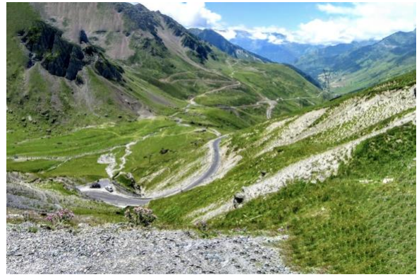
Col du Grande Colombiere

Auf der Strecke werden wir auch durch eine Reihe von pittoresken Orten fahren und je nach Lust & Laune, Kaffeedurst, Hunger und Pausenbedarf anhalten und einkehren.