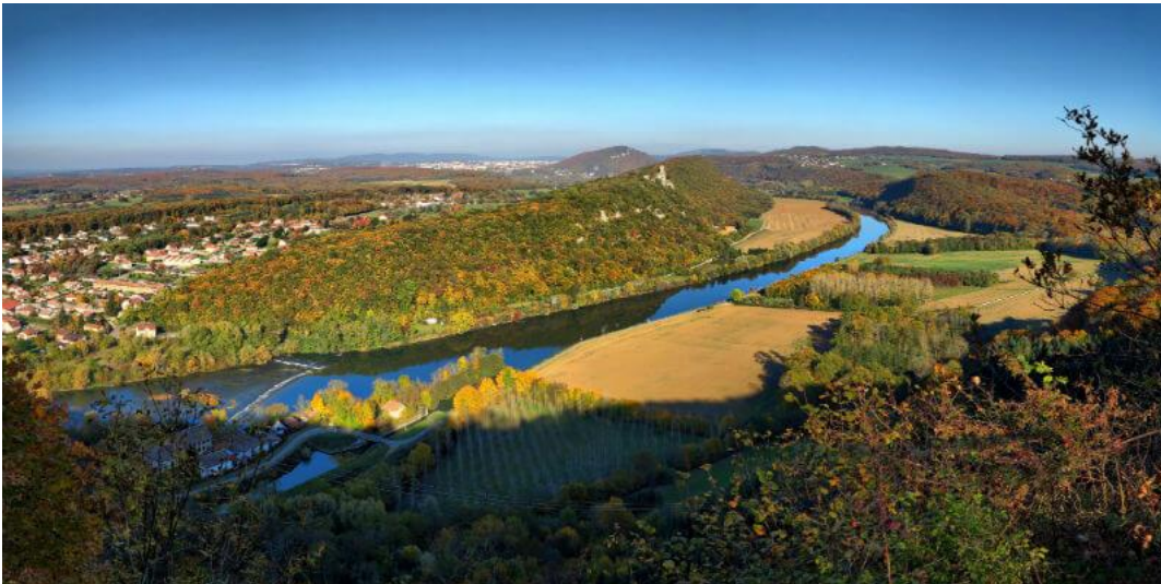
Vallée du Doubs

Wir werden insgesamt 5 Tage unterwegs sein und dabei ca. 1.600 km fahren.